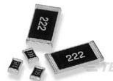
TE 产品编号 1-1879502-0 CRGH2512 5% 33K 2W