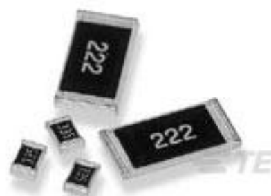
TE 产品编号 1879513-1 CRGH1206 1% 10R 0.5W