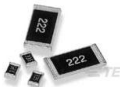
TE 产品编号 9-1879510-1 CRGH0805 1% 10K 0.33W