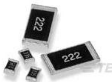
TE 产品编号 6-1879501-0 CRGH2512 5% 300R 2W