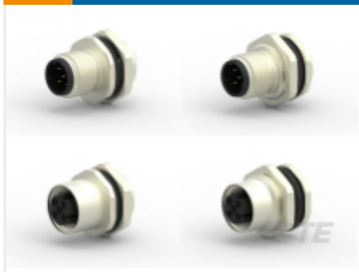
TE 产品编号T4133012051-000 M12 面板安装焊杯