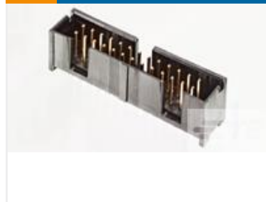
TE 产品编号2-1761603-9 IDC LOW PRO HDR 26P VERT BLUE