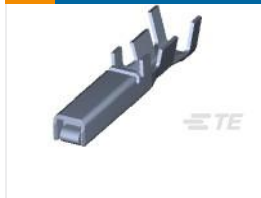
TE 产品编号175196-3 DYNAMIC D-3 REC CONT/L AU 0.76