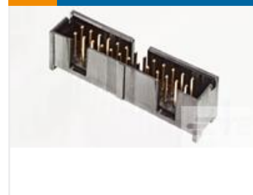
TE 产品编号2-1761603-9 IDC LOW PRO HDR 26P VERT BLUE