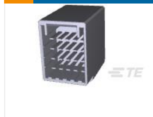
TE 产品编号917251-2 DYNAMIC D-3400F HDR ASSY 20P H