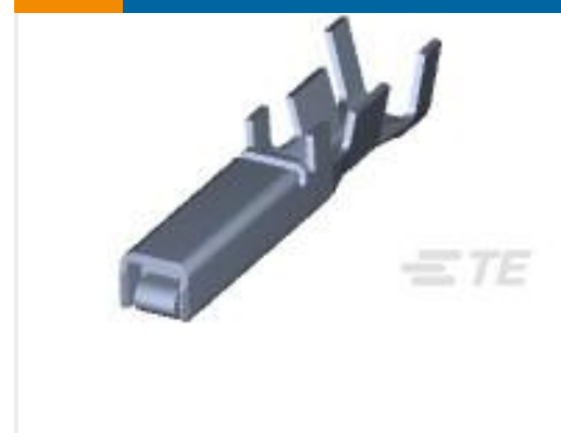
TE 产品编号175196-3 DYNAMIC D-3 REC CONT/L AU 0.76