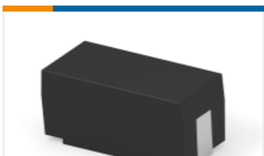
TE 产品编号6-2176619-8 SMQF2W 200K 5%