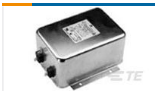
TE 产品编号6609047-5 20VT1 J0=F7814