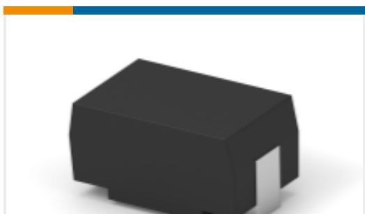
TE 产品编号8-1879234-2 SMD 功率电阻器：7 瓦特，200-2M 欧姆