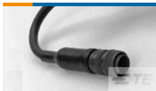
TE 产品编号5660034001 SFR-1/2-0-SP