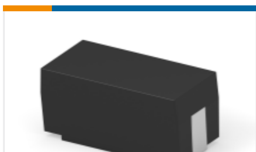
TE 产品编号7-2176618-2 SMQF1W 200K 5%