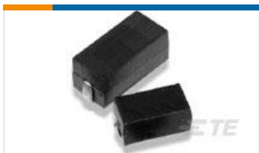
TE 产品编号5-1879233-4 SMW5 16R 5%