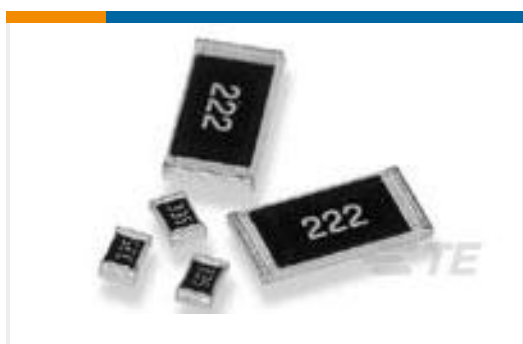
TE 产品编号1623008-1 CRG0603 1% 910K