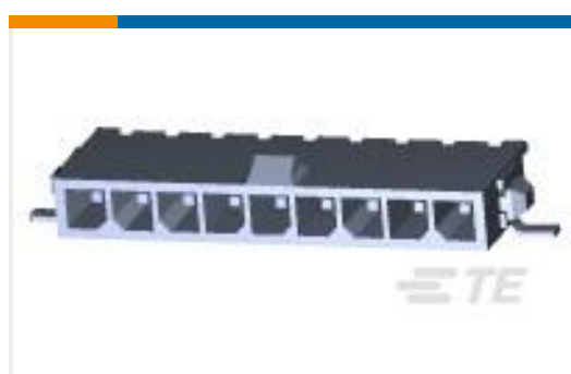
TE 产品编号2-1445091-9 MICRO MNL HDR ASSY S/ROW AU LF