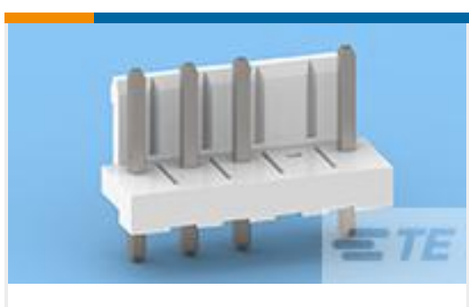
TE 产品编号2-1565036-1 EP CONN.HDR ASSY 4/5POS (NATURAL GWT)