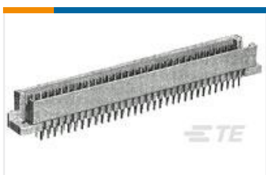
TE 产品编号650922-5 150 EURO TYPE R PIN ST ASSY