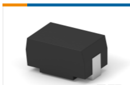
TE 产品编号6-1879234-9 SMD 功率电阻器：7 瓦特，200-2M 欧姆