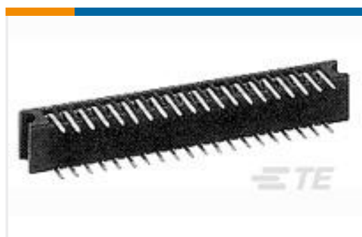
TE 产品编号532956-6 36 MODII 2PC CE RCPT ASSY