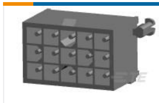
TE 产品编号1-770190-0 15P MINI-UMNL ASSY V0 SNNI*