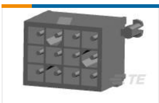
TE 产品编号1-770186-0 12P MINI-UMNL ASSY V0 SNNI*