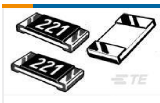
TE 产品编号2-2176070-1 3521 68R 1% 2W