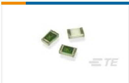
TE 产品编号1676349-3 RN 0805 47K5 0.1% 10PPM 5KRL