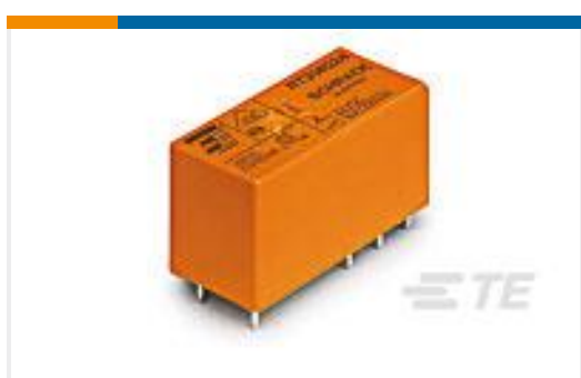
TE 产品编号2-1393237-8 RT424012F