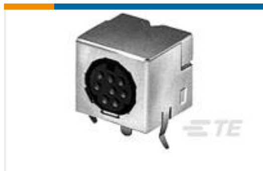
TE 产品编号1658998-1 Mini DIN, 8 pos, R/A, Shield