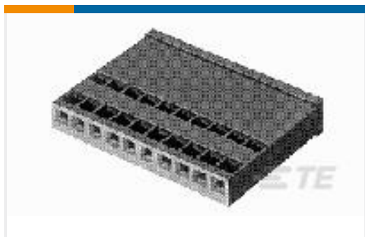
TE 产品编号1-87175-2 05 LOCKING CLIP HSG SR .100CL