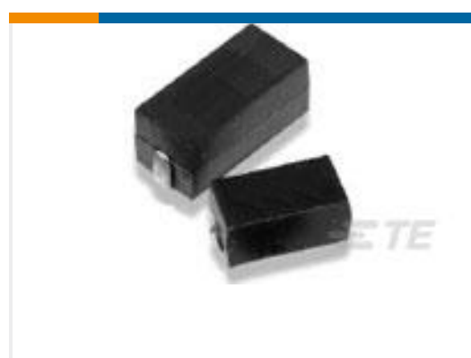
TE 产品编号6-1879233-0 SMW5 30R 5%