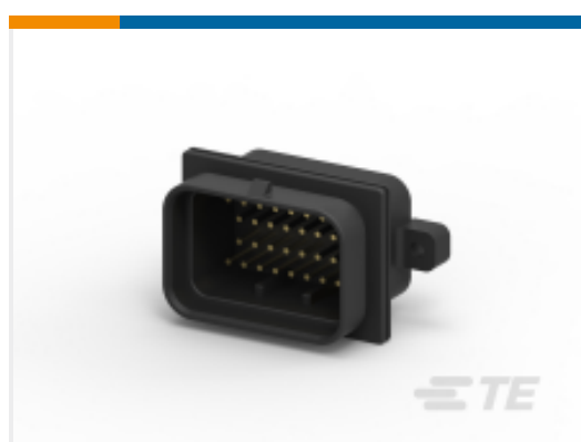
TE 产品编号2-6447232-4 SUPER SEAL 34POS CAP ASSY V AU