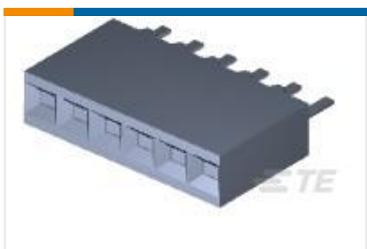
TE 产品编号535541-4 06 MODIV VRT SR CE 100/115