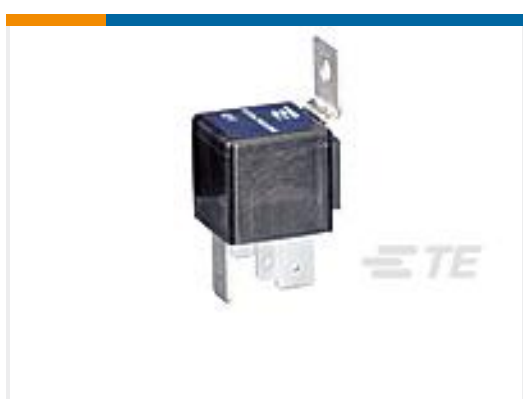
TE 产品编号3-1414937-3 V23134J0065X497-EV-CBOX