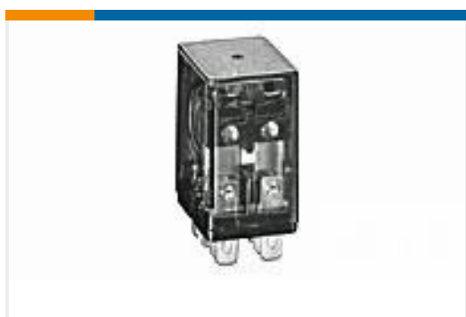
TE 产品编号6-1393144-6 K10P-11D55-12=K10/K20