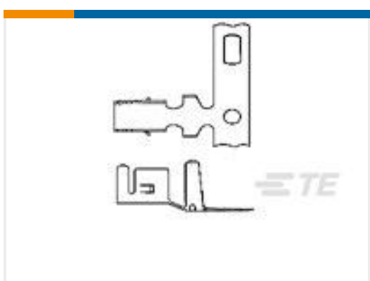
TE 产品编号3-770060-1 MINI AMP-IN PTLP/PHBZ