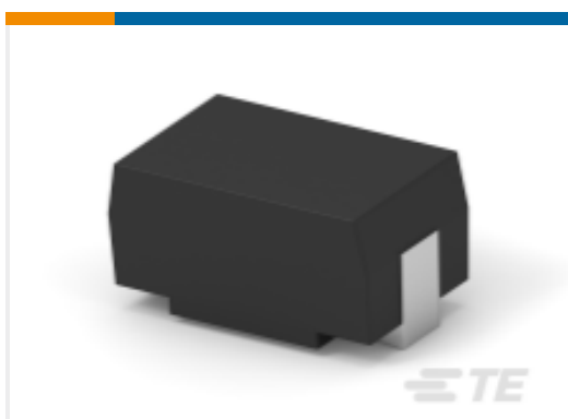
TE 产品编号4-1879021-9 SMD 功率电阻器：7 瓦特，.10-500 欧姆