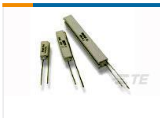
TE 产品编号2-1623728-1 BCHE 11 W 470R 5%