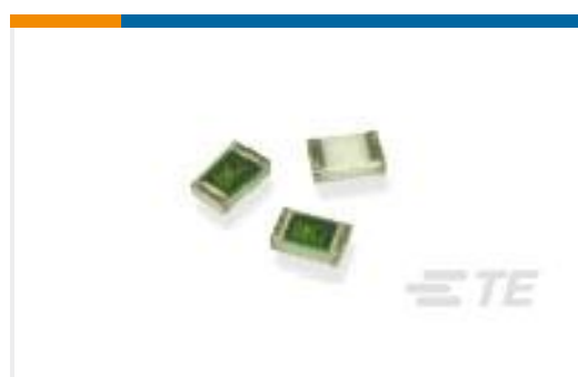
TE 产品编号1676666-2 RN 0805 20R 0.1% 10PPM 1K RL