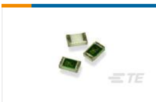
TE 产品编号1879208-1 CPF 0402 10R 0.1% 25PPM 1K RL