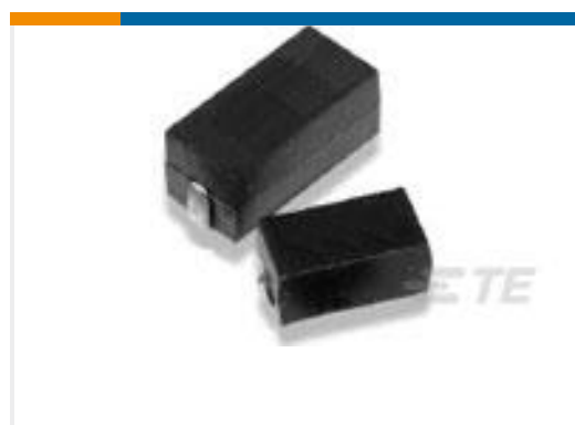
TE 产品编号6-1676966-9 SMW2 68R 5%