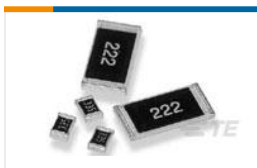
TE 产品编号1623197-1 CRG0805 1% 33K