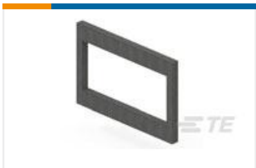
TE 产品编号2132186-1 EMI Gasket, QSFP/XFP 1x1