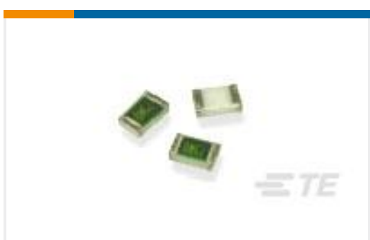
TE 产品编号9-2176093-8 RP 2A 0.25W 110K 0.1% 25PPM 1K RL