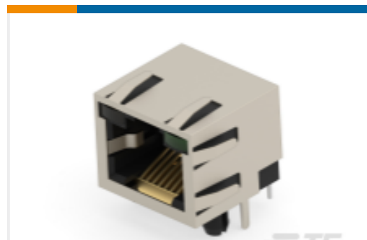
TE 产品编号203532-E MJ ES R L1 8 8 ** GF5 R * 30 * J 3 2035