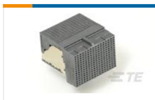
TE 产品编号1934221-1 Tin Man Recept Assy 5 Pair 16 Column