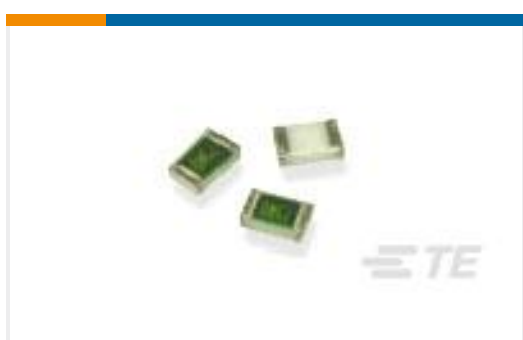
TE 产品编号7-1879134-3 RN 0603 56K2 0.1% 10PPM 1K RL