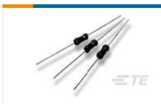
TE 产品编号9-1625892-4 ROX3S 5% R22 BL