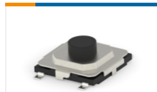
TE 产品编号2337238-3 TACT MINI GW 5.2X5.2X2 160GF