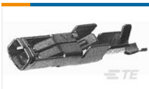
TE 产品编号142316-1 MIC RECEPTACLE VRAC