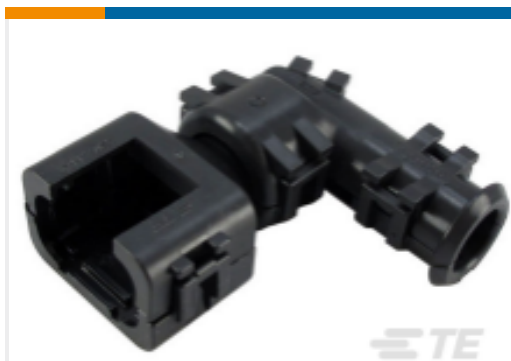
TE 产品编号2302491-3 SOC CONN CVRASSY,2POS, AMPSEAL16,90DEG,MC