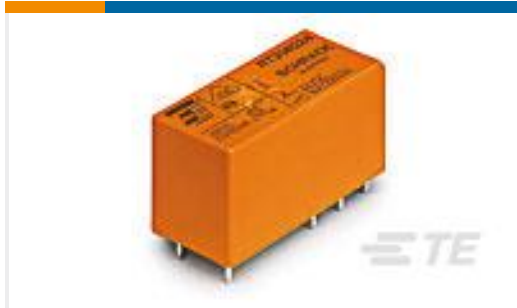
TE 产品编号5-1393238-9 RTD14005