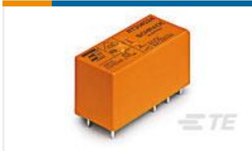
TE 产品编号6-1393238-8 RTD14024