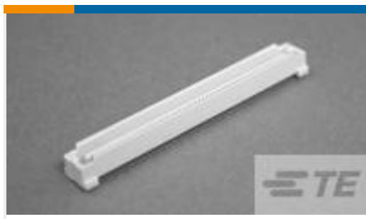
TE 产品编号5177986-8 0.8FH,P05H.5,160,08/Sn,TR,SC