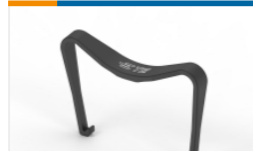
TE 产品编号1860995-1 RT16C01 PLASTIC RETAINING CLIP LOW