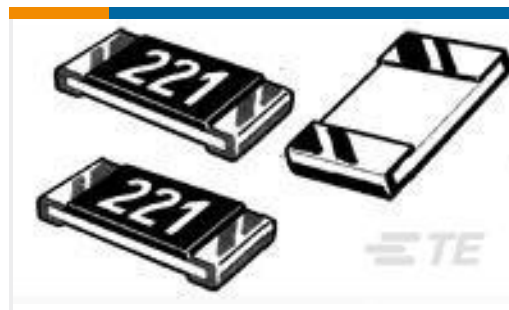
TE 产品编号1-2176071-8 3521 680K 1% 2W