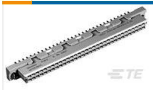
TE 产品编号7-1393640-2 V42254B2201B200=PC612 FEDERLEI