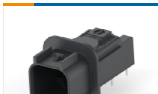
TE 产品编号1802162-1 1-PORT MATENET HDR 90DEG SEALED, COD A