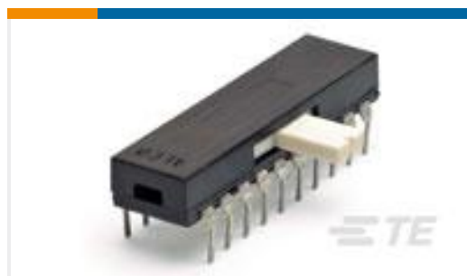
TE 产品编号2-1825010-2 ASE42RL04=4PDT AUTOSLIDE