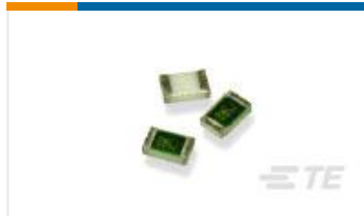
TE 产品编号8-1879214-6 CPF 0402 2K87 0.1% 25PPM 1K RL