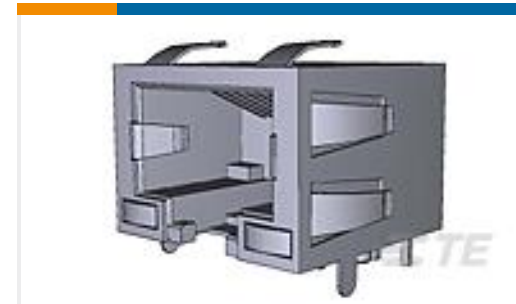
TE 产品编号6-1734324-7 RJ45 w/ Y/GO LED PAL GND T&R 30u"