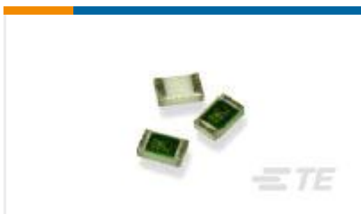
TE 产品编号8-1879208-3 CPF 0402 27K 0.1% 25PPM 1K RL