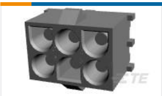
TE 产品编号350762-4 06P UMNL HDR ASSY PC