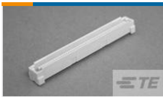
TE 产品编号5179029-3 0.8FH,P06H.5,080,08/Sn,TU