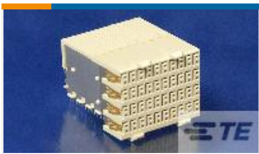
TE 产品编号6469001-1 HM-ZD 4PR RECP 80P