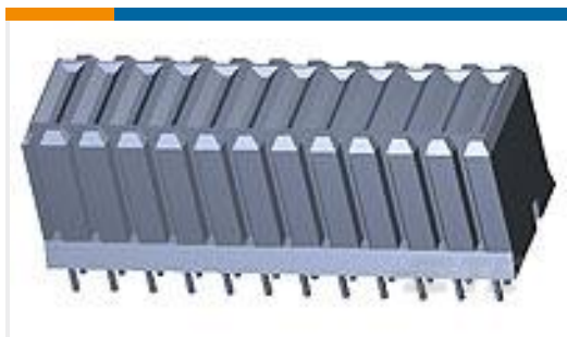
TE 产品编号120953-1 TE UPM Ver Receptacle 4P HC Power