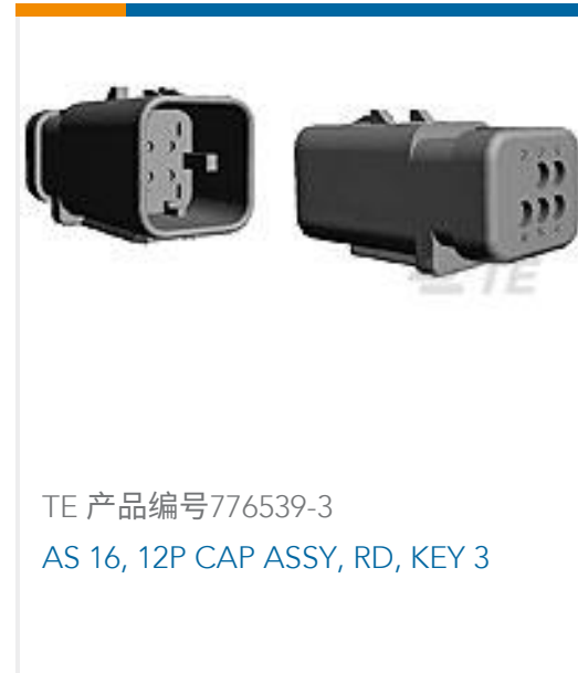
TE 产品编号776539-3 AS 16, 12P CAP ASSY, RD, KEY 3