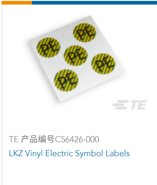
TE 产品编号C56426-000 LKZ Vinyl Electric Symbol Labels