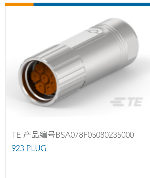
TE 产品编号BSA078F05080235000 923 PLUG