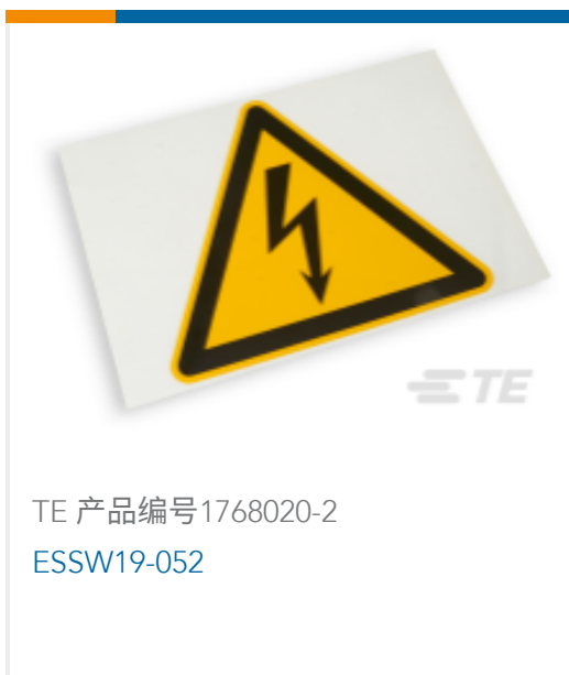
TE 产品编号1768020-2 ESSW19-052