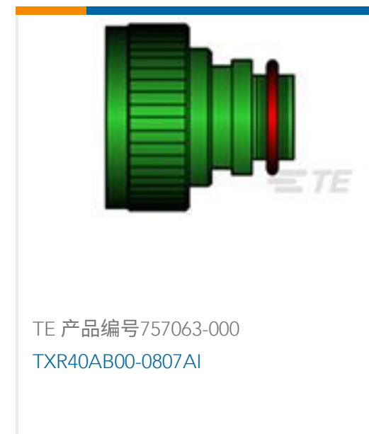
TE 产品编号757063-000 TXR40AB00-0807AI