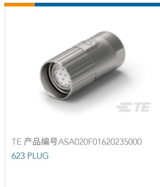
TE 产品编号ASA020F01620235000 623 PLUG