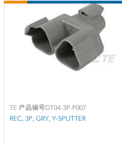
TE 产品编号DT04-3P-P007 REC, 3P, GRY, Y-SPLITTER