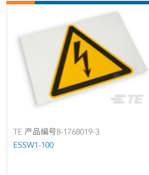
TE 产品编号8-1768019-3 ESSW1-100