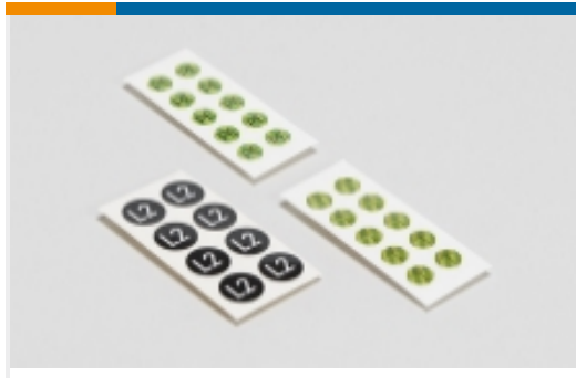
安全符号和电气符号(44)