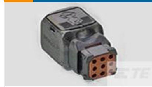
TE 产品编号D369-R99-CS1 369 9 WAY REC, CRIMP, SKT