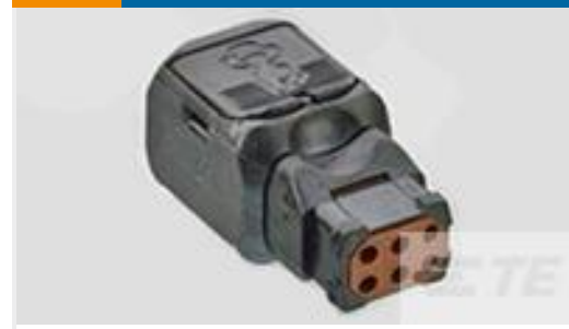
TE 产品编号D369-R66-DS1 369 6 WAY REC, CRIMP, SKT