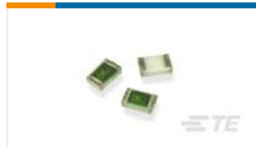
TE 产品编号3-1879129-7 RN 0402 1K62 0.1% 10PPM CUT LENGTH