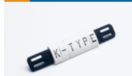
TE 产品编号EC6429-000 K-Type Tie-On Markers