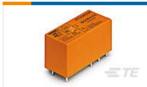
TE 产品编号6-1393243-3 RT424012