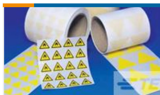
TE 产品编号 7-1768018-2 EET-2551P-4