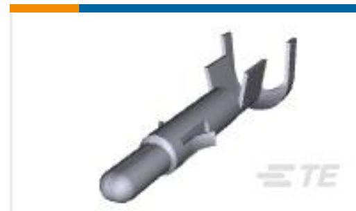
TE 产品编号926899-3 UNIV-MNL SPLIT ST