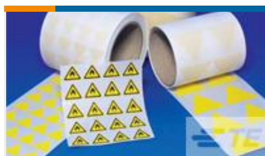
TE 产品编号 6-1768018-7 EET-2338P-4