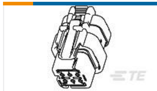
TE 产品编号776494-1 AS 16, 8P PLUG ASSY, KEY 1