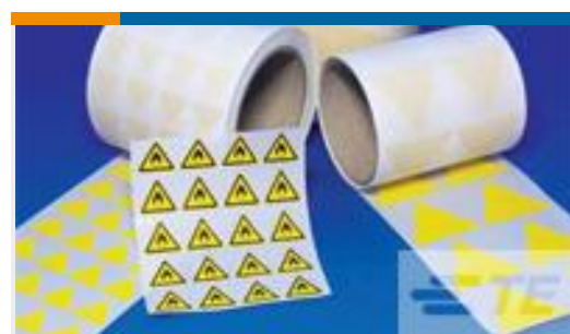
TE 产品编号 4-1768018-2 EET-1325P-4