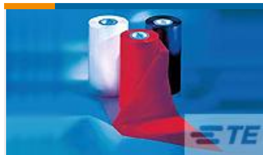
TE 产品编号980892-000 1330-3300-10