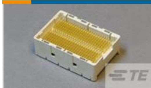
TE 产品编号 6-1761614-2 STEP-Z PLUG 12MM 200P LF ST