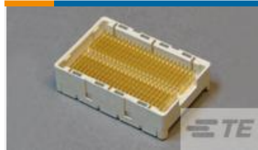
TE 产品编号 6-2007614-0 STEP-Z PLUG 10MM 200P LF HT