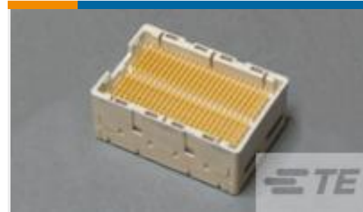
TE 产品编号 6-2007614-5 STEP-Z PLUG 15MM 200P LF HT