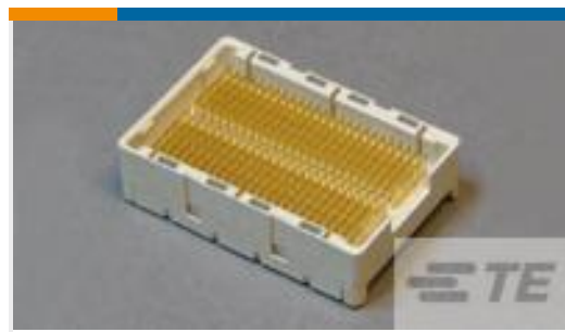
TE 产品编号 6-1761614-0 STEP-Z PLUG 10MM 200P LF ST