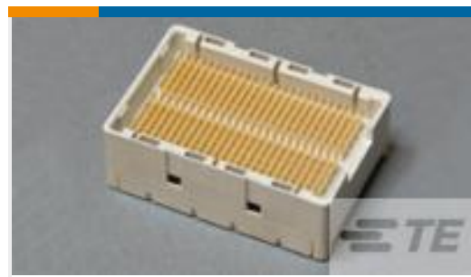
TE 产品编号 6-1761614-3 STEP-Z PLUG 13MM 200P LF ST