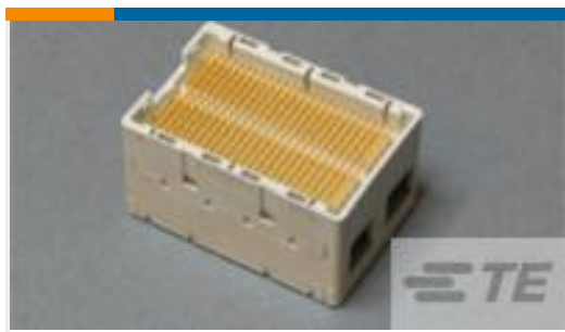
TE 产品编号 7-1761614-0 STEP-Z PLUG 20MM 200P LF ST