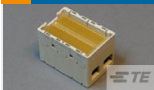
TE 产品编号 7-1761614-5 STEP-Z PLUG 25MM 200P LF ST