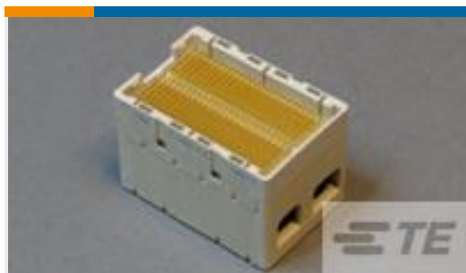
TE 产品编号 7-2007614-5 STEP-Z PLUG 25MM 200P LF HT