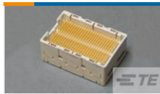
TE 产品编号 6-1761614-5 STEP-Z PLUG 15MM 200P LF ST