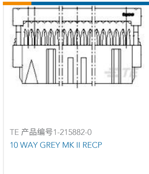
TE 产品编号1-215882-0 10 WAY GREY MK II RECP