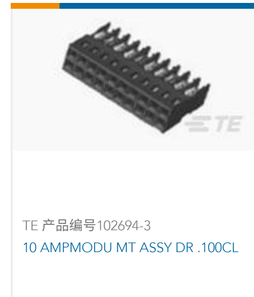
TE 产品编号102694-3 10 AMPMODU MT ASSY DR .100CL