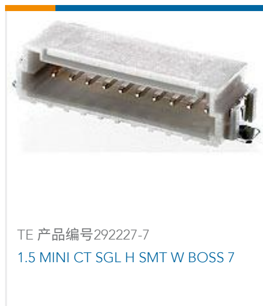
TE 产品编号292227-7 1.5 MINI CT SGL H SMT W BOSS 7