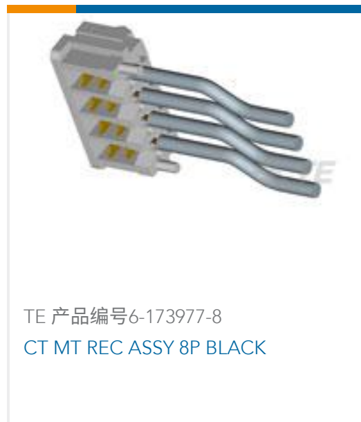
TE 产品编号6-173977-8 CT MT REC ASSY 8P BLACK