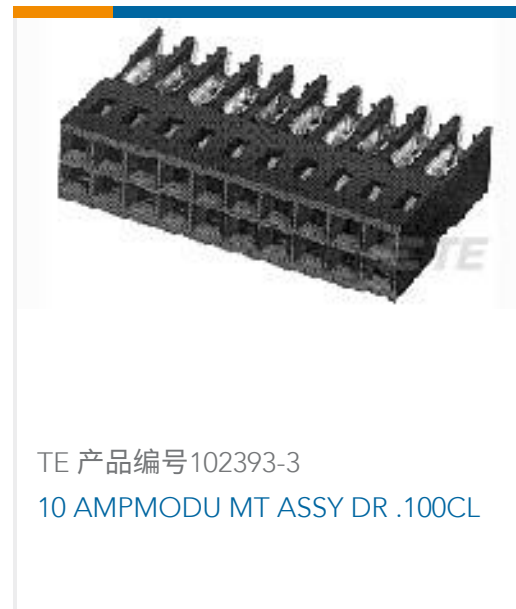
TE 产品编号102393-3 10 AMPMODU MT ASSY DR .100CL