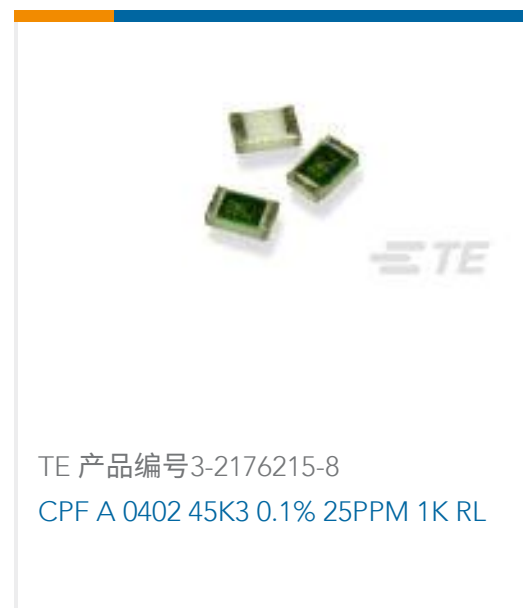
TE 产品编号3-2176215-8 CPF A 0402 45K3 0.1% 25PPM 1K RL