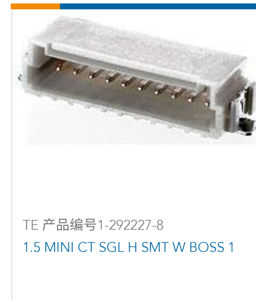
TE 产品编号1-292227-8 1.5 MINI CT SGL H SMT W BOSS 1