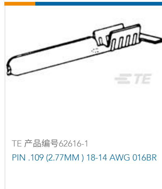
TE 产品编号62616-1 PIN .109 (2.77MM) 18-14 AWG 016BR