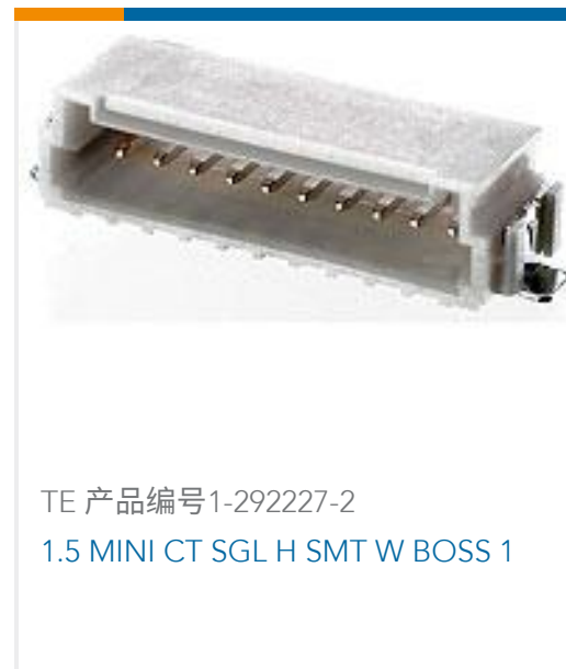
TE 产品编号1-292227-2 1.5 MINI CT SGL H SMT W BOSS 1