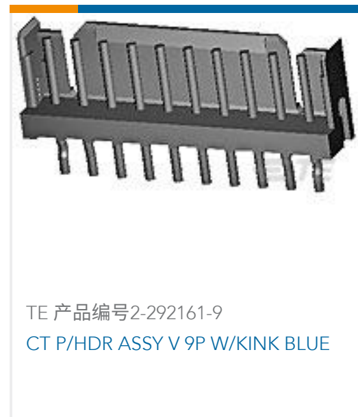
TE 产品编号2-292161-9 CT P/HDR ASSY V 9P W/KINK BLUE