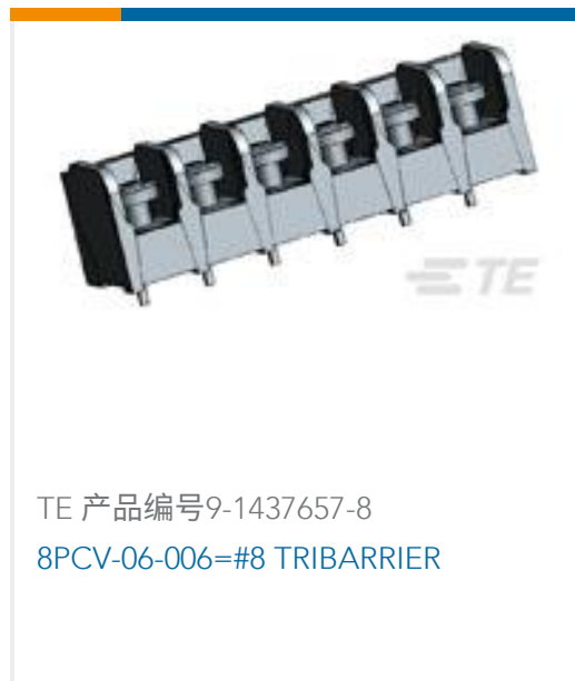
TE 产品编号9-1437657-8 8PCV-06-006=#8 TRIBARRIER