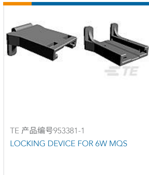
TE 产品编号953381-1 LOCKING DEVICE FOR 6W MQS