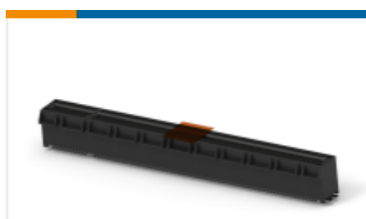
TE 产品编号 5-2337939-4 PCIE GEN4 CON,SMT,164POS,30u", MYLAR,HT