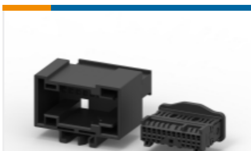
TE 产品编号185311-1 MQS 连接器外壳