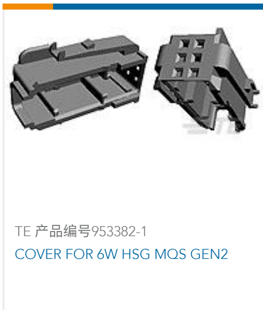
TE 产品编号953382-1 COVER FOR 6W HSG MQS GEN2