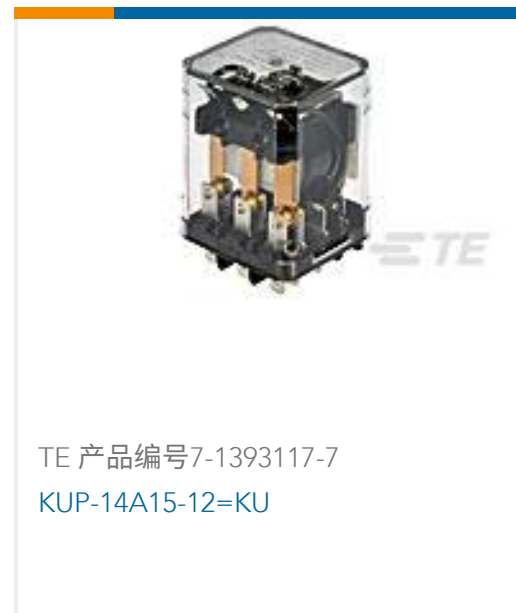
TE 产品编号7-1393117-7 KUP-14A15-12=KU