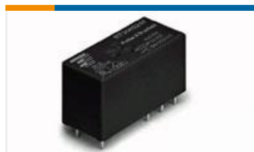
TE 产品编号2-1419108-4 RTB14005F