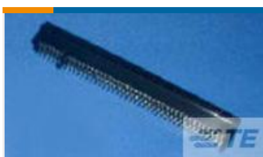
TE 产品编号 1734774-1 PCI EXP 3.1L 36 POS WHT G/F