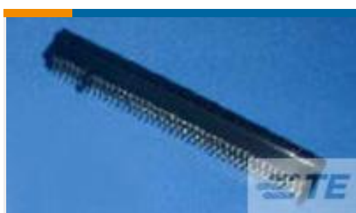
TE 产品编号 1734774-1 PCI EXP 3.1L 36 POS WHT G/F