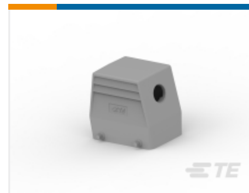
TE 产品编号T1319320120-000 H32A-TS-M20