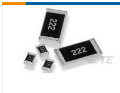
TE 产品编号3-2176067-2 CRG0201 1% 44R2