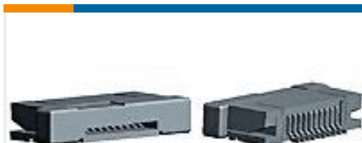
TE 产品编号2-1734592-9 FPC CONN. 0.5MM PITCH B/C, 29P