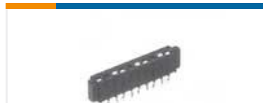
TE 产品编号5-520315-3 TRIOMATE ASSY V 3P L=3.556LDFR