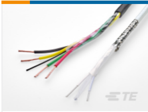
TE 产品编号EL7577-000 CBS-18C902XUU3A-0