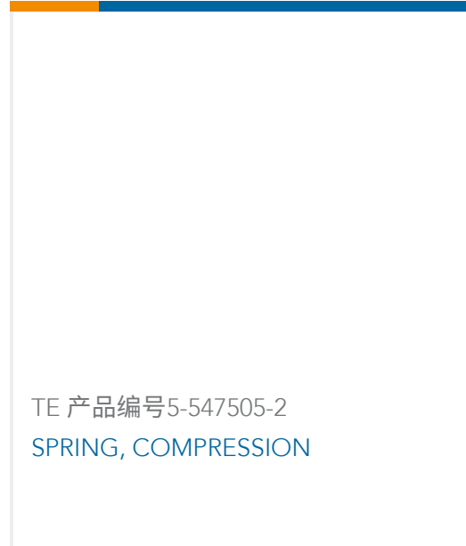
TE 产品编号5-547505-2 SPRING, COMPRESSION