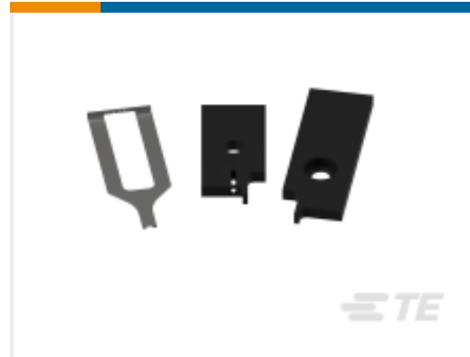
TE 产品编号2119780-9 DEPRESSOR, SHEAR