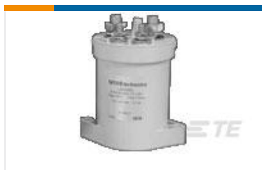
TE 产品编号9-1618389-8 LEV100A5ANG=RELAY, SPST, 24Vdc