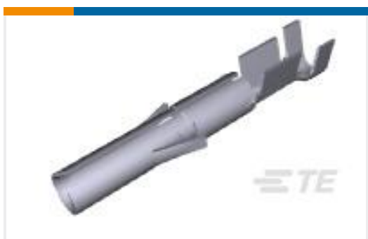
TE 产品编号350570-2 UMNL SOK 24-18 AUBR