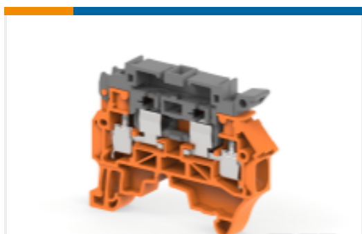
TE 产品编号1SNK508430R0000 ZS4-SF1-OR