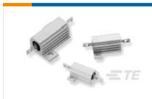
TE 产品编号4-1879071-3 THS50 220R 5%