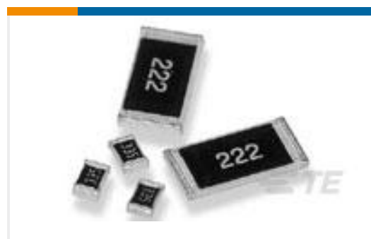
TE 产品编号1622829-1 CRG0603 1% 10K