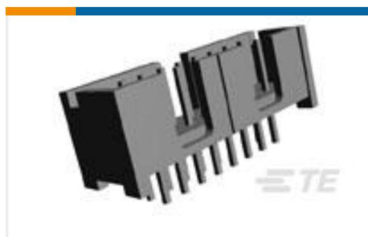
TE 产品编号103308-2 014 LOPRO HDR SP 15DP