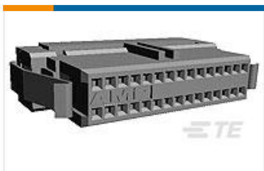
TE 产品编号2-111196-8 024 RCPT SYSTEM 50 30 DPLX