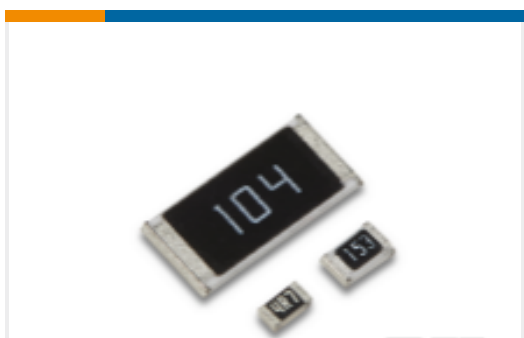
TE 产品编号3-2176339-8 CRGCQ 0603 12K 1%