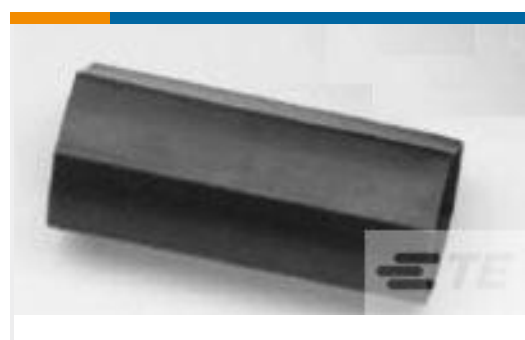
TE 产品编号156082-000 HRHT-4/3