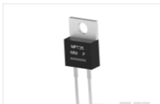
TE 产品编号3-2176430-7 MPT35 2R7 1%