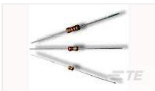
TE 产品编号 2-1623933-3 CFR50 5% 3M9