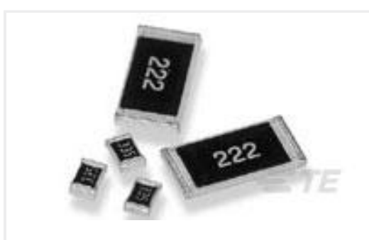
TE 产品编号4-1879377-0 CRGH0805 5% 39R 0.33W