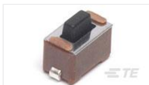
TE 产品编号1437566-3 FSMSM=3.5X6 SMT TACT