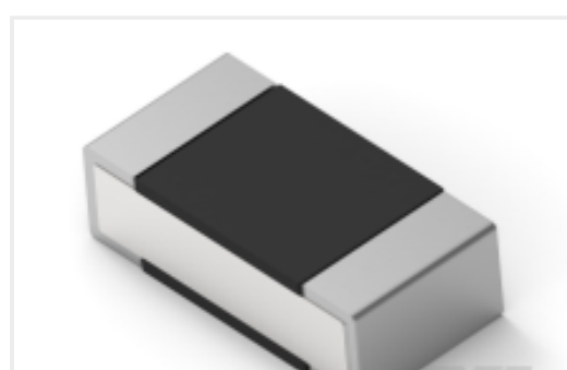
TE 产品编号5-2176312-7 RP 1E 0.1W 47K5 0.1% 25PPM 1K RL