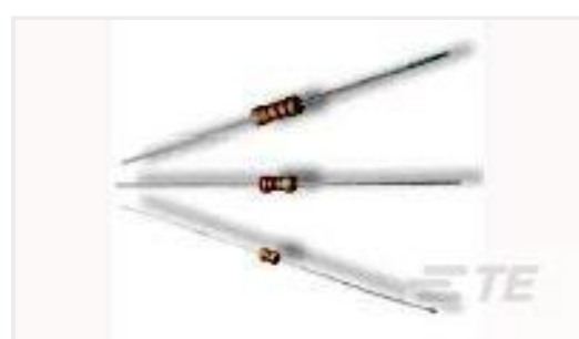
TE 产品编号 3-1623933-0 CFR50 5% 470R