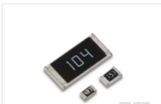
TE 产品编号2-2176341-3 CRGCO 0805 680R 1%