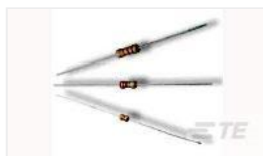
TE 产品编号 8-1623933-5 CFR50 5% 5K1