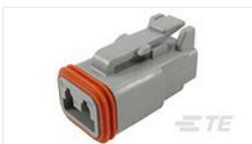
TE 产品编号DT06-2S-C015 PLG, 2P, GRY, E