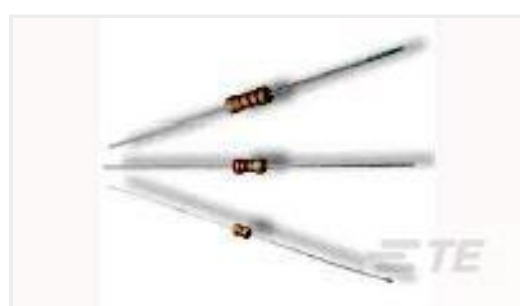
TE 产品编号 4-1623933-7 CFR50 5% 5K6