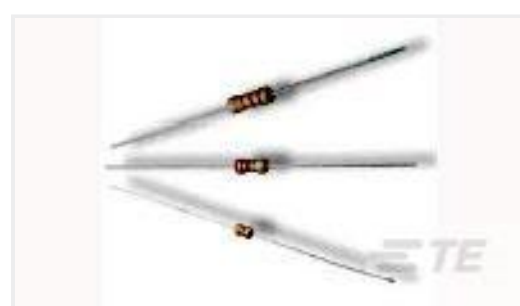
TE 产品编号 6-1623933-2 CFR50 5% 75K