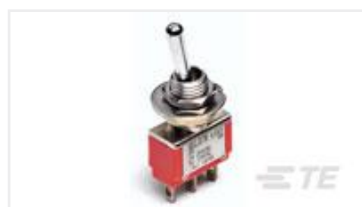
TE 产品编号3-1825136-5 A101SD9AV2Q04