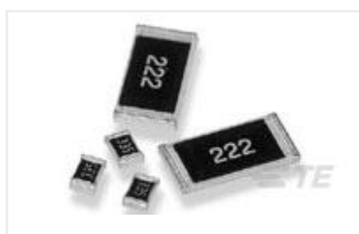
TE 产品编号8-1879507-5 CRGH0603 1% 1M0 0.2W