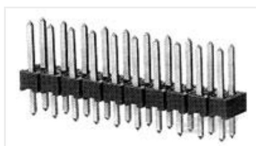
TE 产品编号826632-3 3P AMPMODU II PIN HDR.