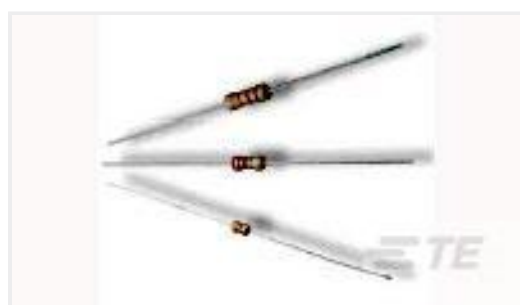
TE 产品编号 1623933-4 CFR50 5% 330R