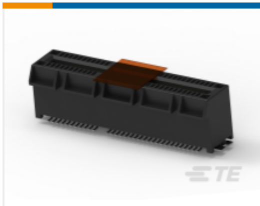
TE 产品编号4-2337939-2 PCIE GEN4 CON,SMT,64POS,15u", MYLAR,ST