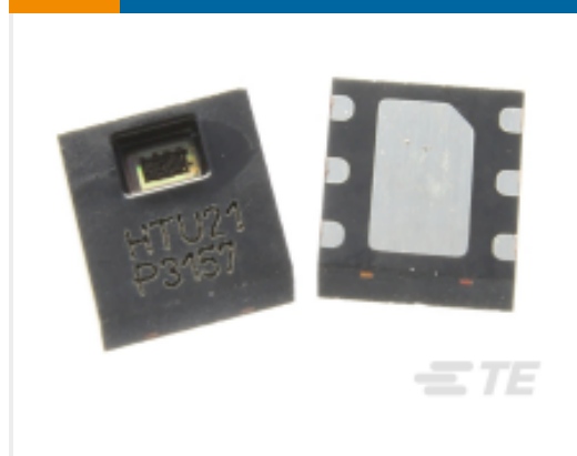
TE 产品编号HPP845E032R4 I.C 21P RH/T PWM B400