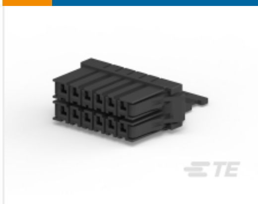
TE 产品编号2-2303378-1 D3200 FMLB REC STRAIN RELIEF KIT 12P SS