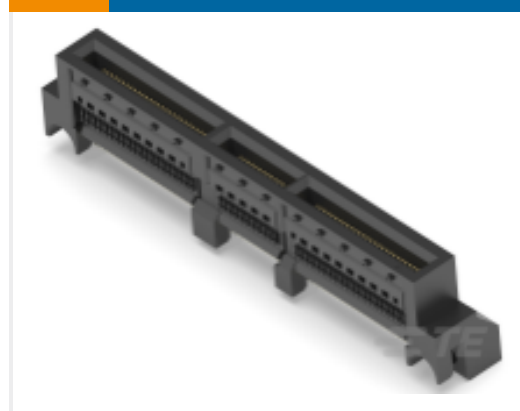
TE 产品编号2340324-1 ASSY STRADDLE MOUNT 140P 062 SLIVER 2.0