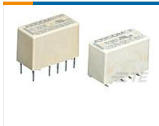
TE 产品编号2-1393789-7 V23079J1103B301=MINIATURELRAIS