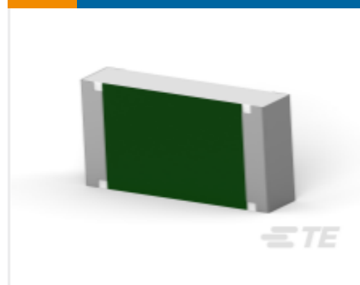
TE 产品编号2-2176398-7 3502 160K 1%