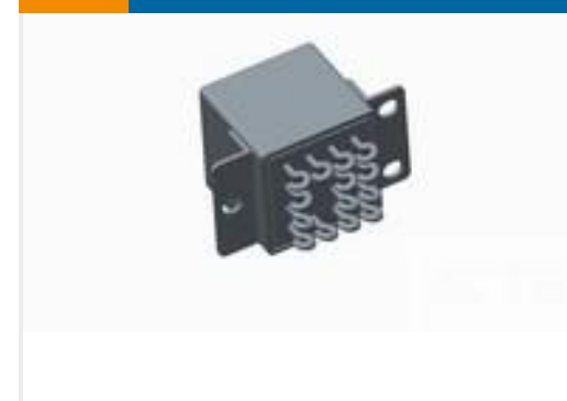
TE 产品编号2-1617807-4 TD228-2202S=TDFO 22 SEC M83726 /28-2202S