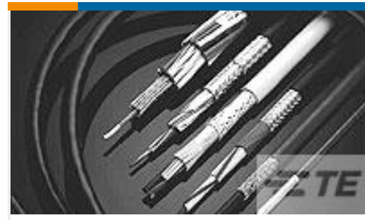
TE 产品编号821793-000 CMC-0553-6-9