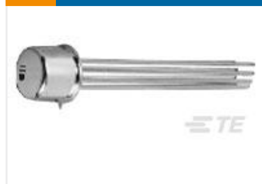
TE 产品编号5-1617568-5 JMAWD-6XP=M39016/15-029P