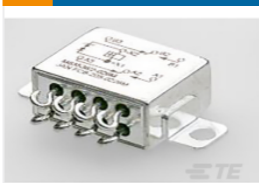
TE 产品编号9-1617784-2 FCB-205-0117M=M83536/1-017M