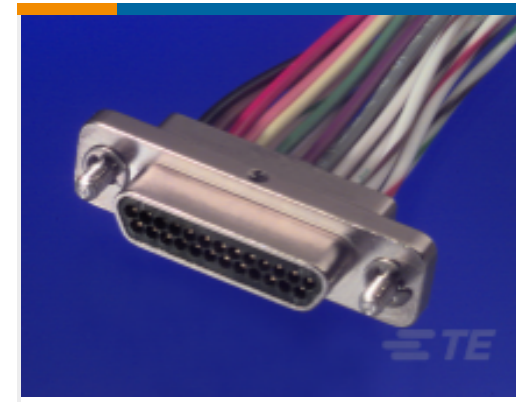
TE 产品编号2-1532186-9 M83513/03-H12C, MCKS-C2-B-100P6Q9-36.0