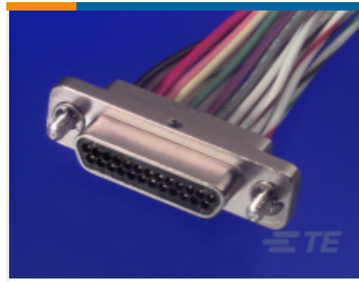
TE 产品编号2-1532179-4 M83513/03-A08C, MCKS-C2-B-9P5L5-1.0