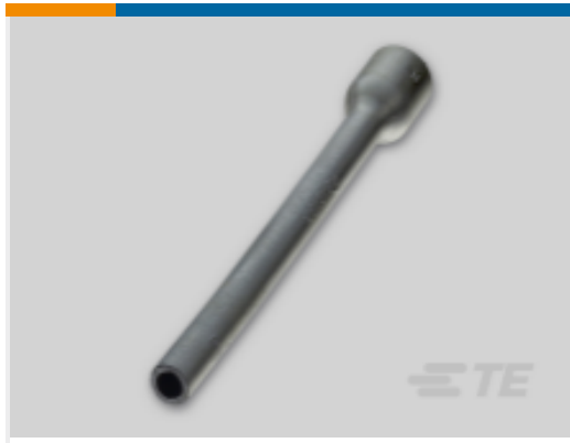
TE 产品编号707509-000 202F263-51-22/164-0