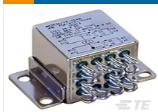
TE 产品编号5-1617808-6 TD228-1103P=TDFO 110 SEC M83726 /28-1103P