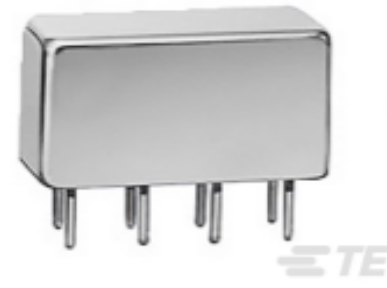
TE 产品编号3-1617536-2 HFW1230F01P=M39016/6-119P