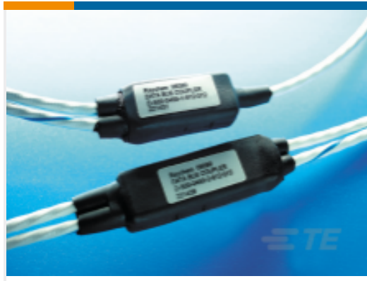
TE 产品编号743487-000 D-500-0255-022