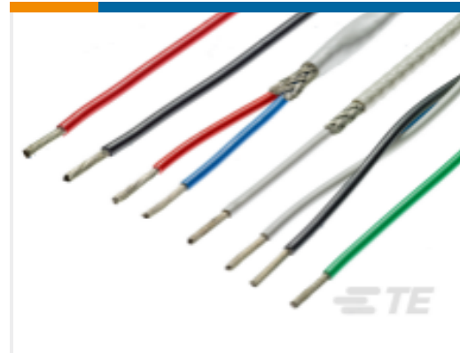
TE 产品编号387778-000 44A1111-22-90-9