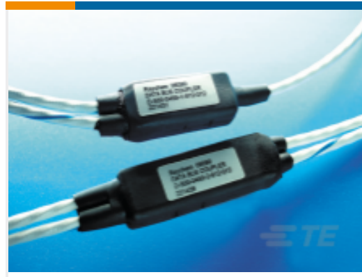
TE 产品编号455188-000 D-500-0255-021-02