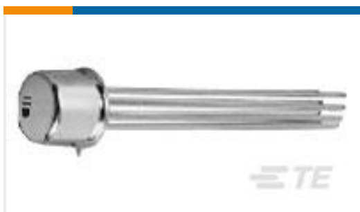
TE 产品编号3-1617118-0 J1MACDD-12XP = M39016/24-028P