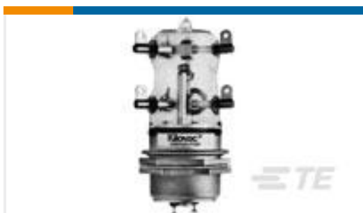
TE 产品编号1-1618273-5 H-16C=RELAY, VACUUM, DPDT