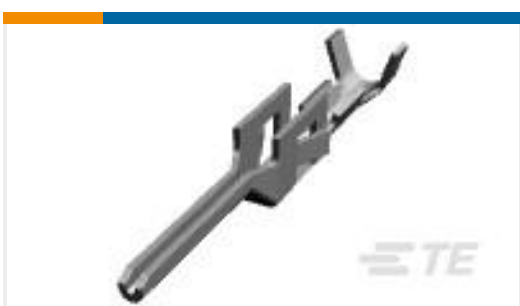
TE 产品编号1-794613-2 PIN CONT 26-30 30 GOLD L/P