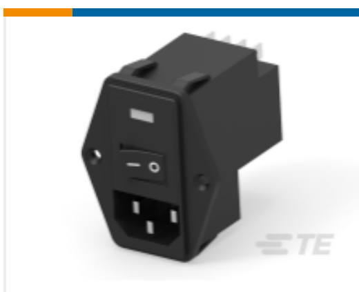
TE 产品编号5-6609929-0 PE0S0DH60=C2264