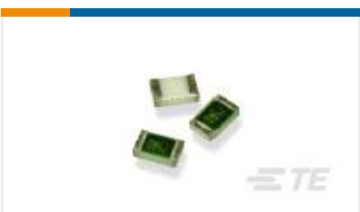
TE 产品编号8-1879208-0 CPF 0402 20K 0.1% 25PPM 1K RL