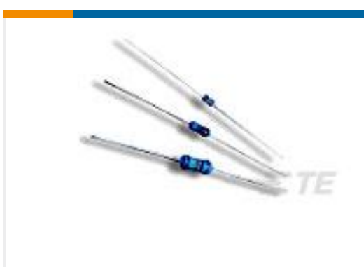
TE 产品编号2-1676913-7 YR1 0.1% 1M0