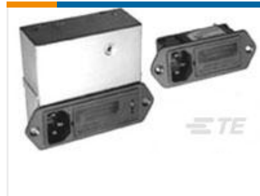
TE 产品编号1-6609130-5 5EHM4S=F8117