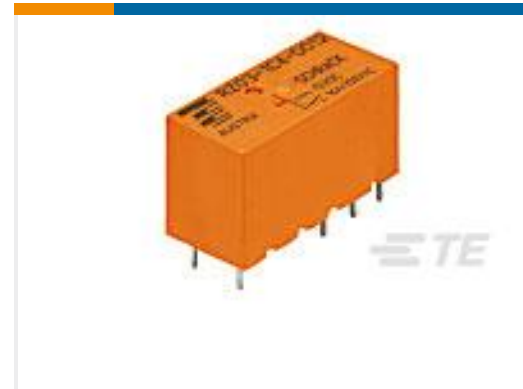
TE 产品编号2-1415899-2 RZ03-1C4-D012