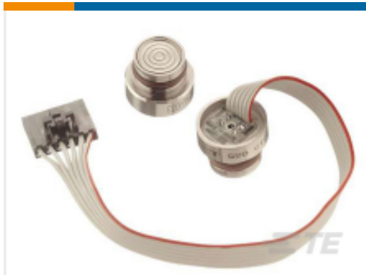
TE 产品编号85-015G-FC 15 PSIG FLUSH MOUNT PRESSURE SENSOR