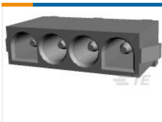
TE 产品编号350430-1 04P UMNL PIN HDR ASSY NATL