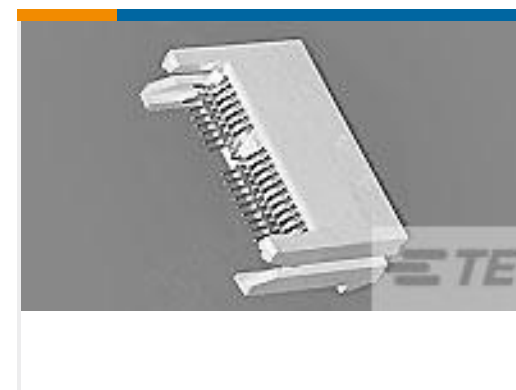
TE 产品编号5-1734857-1 PCI EXP STRADDLE 36P BLK 1u"