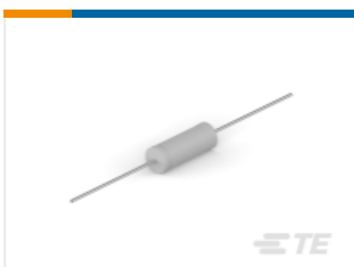
TE 产品编号2-2176412-4 5W XSM M/OX 5% 47R