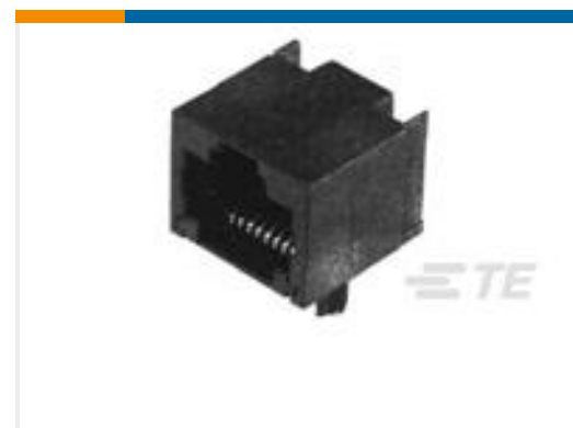
TE 产品编号1-406525-1 IMJ,NO SHLD,8P,TRAY, SN