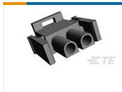
TE 产品编号1-480698-0 02P UMNL PLUG HSG NATL