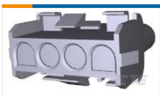
TE 产品编号1-480703-0 04P UMNL CAP HSG NATL