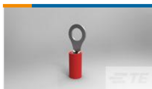
TE 产品编号36154 PIDG R 22-16 COMM 22-18 MIL 10