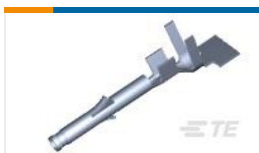
TE 产品编号171639-1 MINI U-M-N-L SOCKET L.P