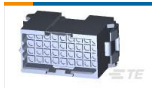
TE 产品编号207020-1 METRIMATE RCPT 36 POS