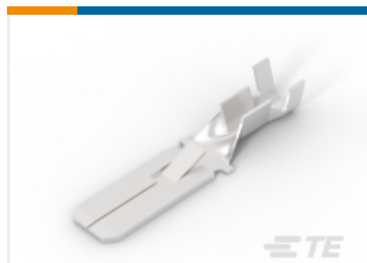
TE 产品编号160451-3 FF 250 TAB 18-14AWG PB SILVER PL LP