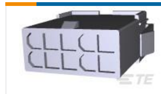
TE 产品编号794942-1 10P MINI UMNL CAP HSG