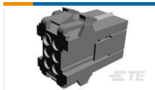
TE 产品编号207153-1 6 POS SQ GRID METRIMATE-RCPT