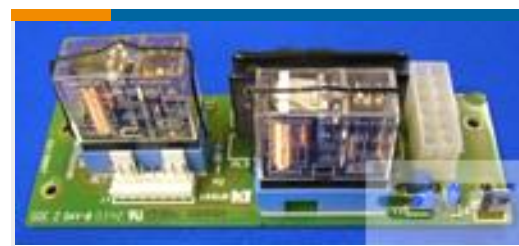
TE 产品编号537221-1 RBK-ILS-MK2/3-PWR-SW-ASSY