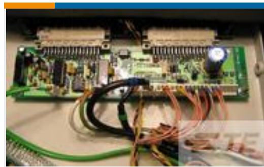
TE 产品编号537221-4 RBK-ILS-MK2/3-INTFC-PCB