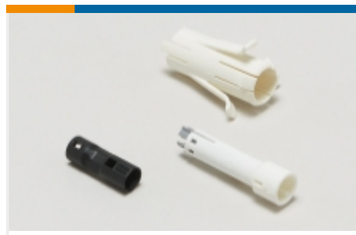
插头和插座照明连接器附件(57)