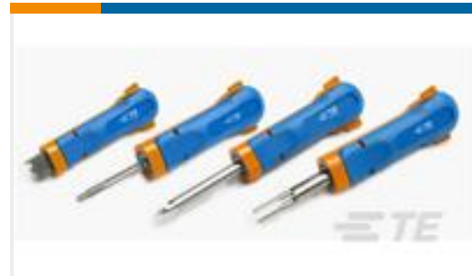
TE 产品编号1-1579007-1 EXTRACTION TOOL