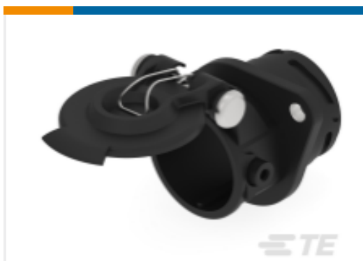
TE 产品编号967403-1 ABS ST-GEH 5+7P