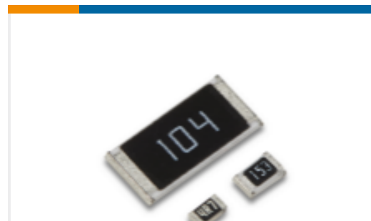
TE 产品编号2176347-6 CRGCO 2010 27R 1%