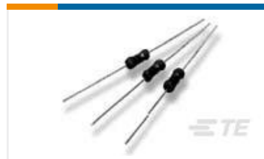
TE 产品编号9-1879352-1 RR02 5% 1K8 AMMO