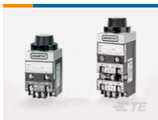
TE 产品编号 1423162-5 7022AC=RLY,STD,OFF,2P 120VAC,1