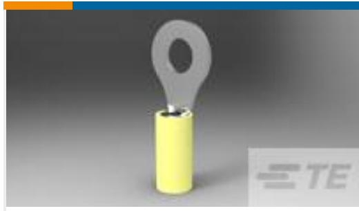
TE 产品编号320569 TERMINAL,PIDG R 12-10 1/4