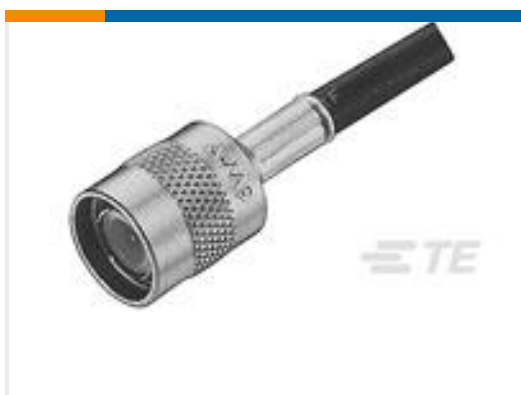
TE 产品编号 5225555-7 TNC PLUG