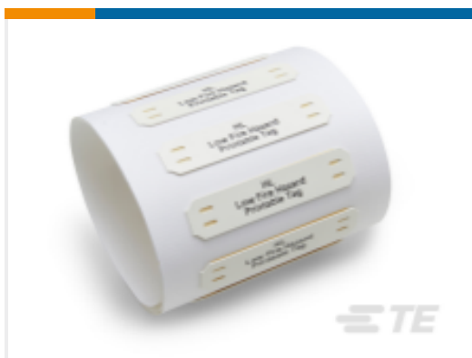
TE 产品编号 EC7590-000 HL Low Fire Hazard Markers