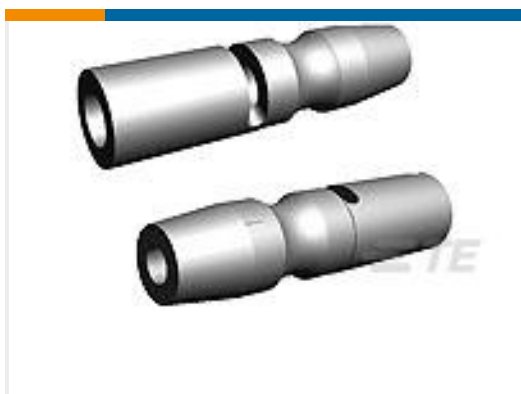
TE 产品编号 34846 SHUR-PLUG,16-14