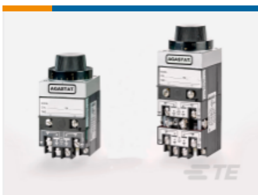
TE 产品编号 2-1423157-4 7012AK=RLY,STD,ON,2P,120VAC,30