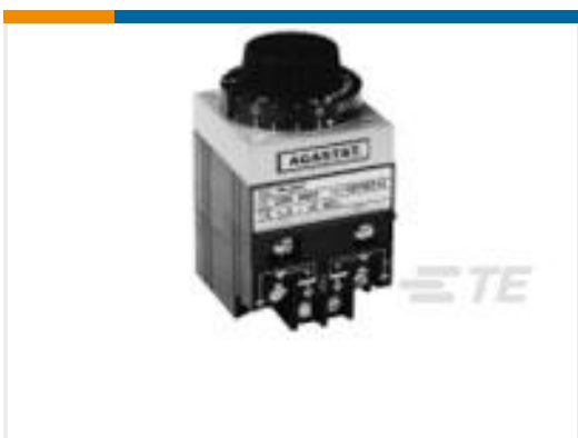
TE 产品编号 2-1423166-8 7024VC=RLY,STD,OFF,4P,32V,15S