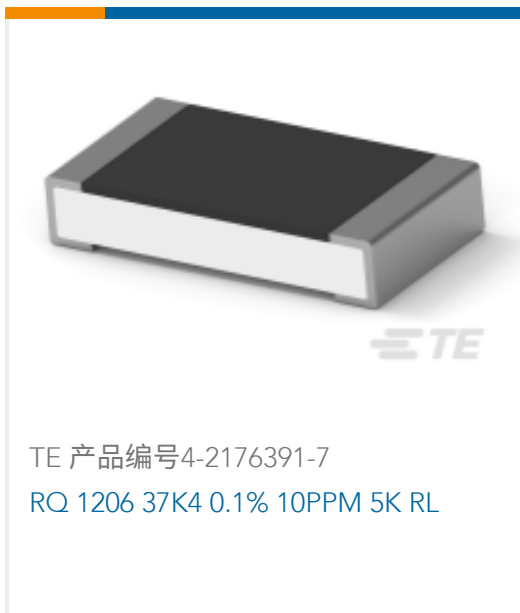
TE 产品编号4-2176391-7 RQ 1206 37K4 0.1% 10PPM 5K RL