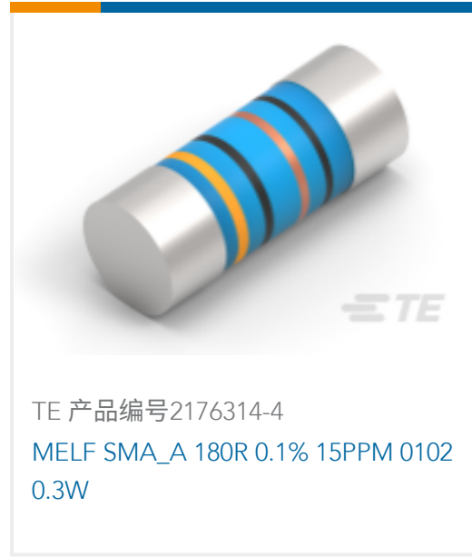
TE 产品编号2176314-4 MELF SMA_A 180R 0.1% 15PPM 0102 0.3W