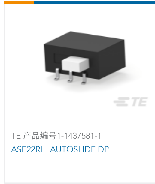
TE 产品编号1-1437581-1 ASE22RL=AUTOSLIDE DP 0.3W