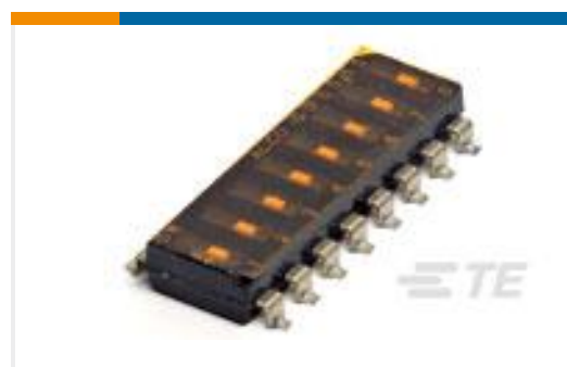
TE 产品编号1-1825006-9 GDS10S04=DIP SW,SLIDE,SMT