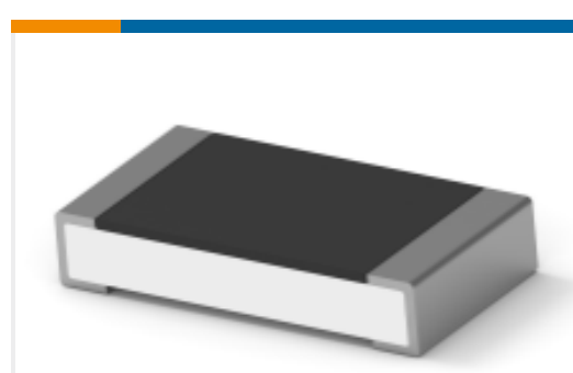
TE 产品编号4-2176391-7 RQ 1206 37K4 0.1% 10PPM 5K RL