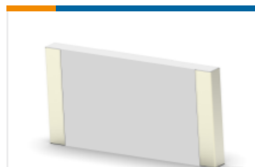
TE 产品编号7-2176246-6 CRGS2512 5% 1M8