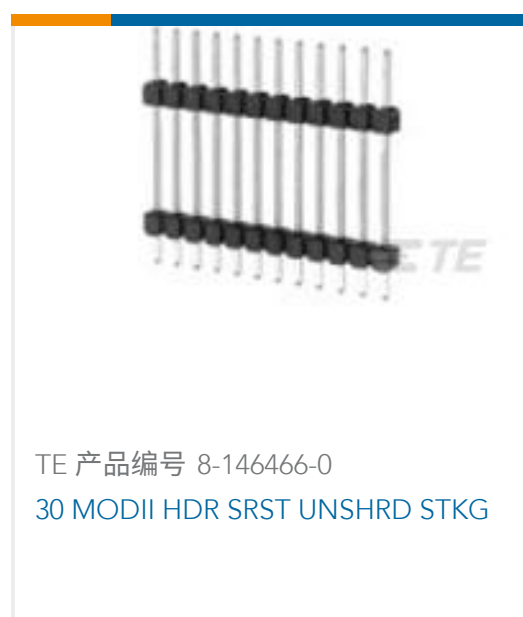
TE 产品编号 8-146466-0 30 MODII HDR SRST UNSHRD STKG