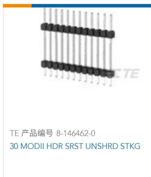
TE 产品编号 8-146462-0 30 MODII HDR SRST UNSHRD STKG