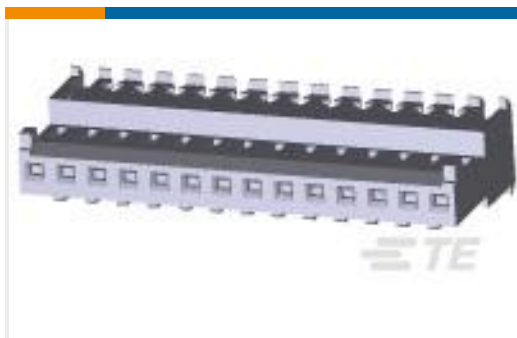
TE 产品编号4-644563-4 14P MTA100 CONN ASSY F/T 24AWG