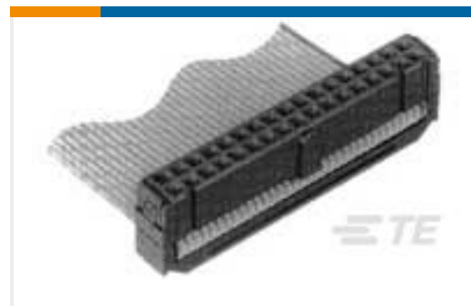
TE 产品编号1658622-1 10 NOVO MIL/CTR 30DP, LEAD FREE