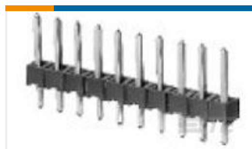
TE 产品编号5-146281-8 08 MODII HDR SRST B/A .100CL