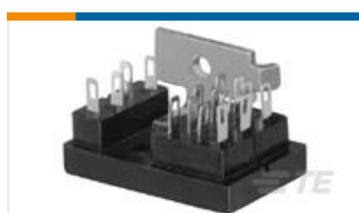
TE 产品编号1-1393143-5 27E152=SOCKET, R10, ASSY, W/BRK