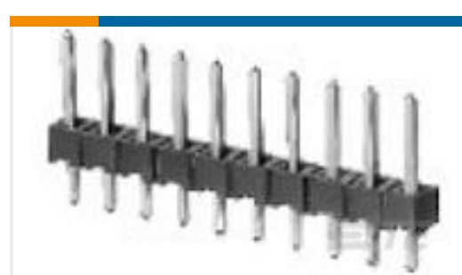
TE 产品编号6-146280-5 15 MODII HDR SRST B/A .100CL