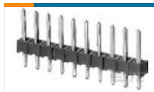
TE 产品编号5-146281-2 02 MODII HDR SRST B/A LF