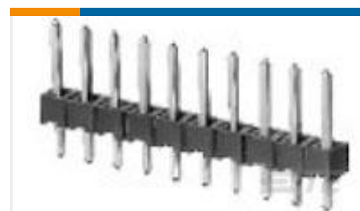
TE 产品编号6-146280-5 15 MODII HDR SRST B/A .100CL