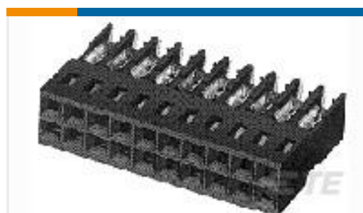
TE 产品编号102393-6 16 AMPMODU MT ASSY DR .100CL