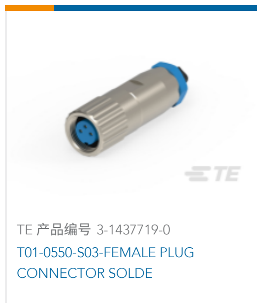
TE 产品编号 3-1437719-0 T01-0550-S03-FEMALE PLUG CONNECTOR SOLDE