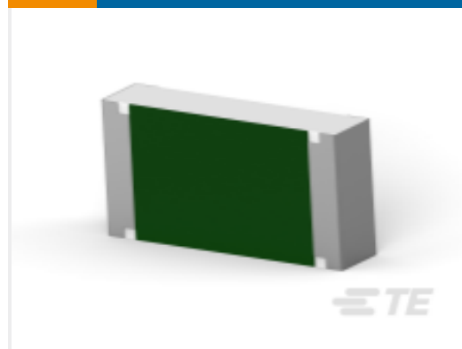
TE 产品编号 1-2176398-4 3502 47K 1%