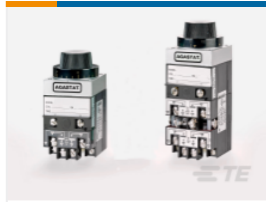
TE 产品编号 1755170-1 7022OCIM=RLY,STD,OFF,2P,24V,15S,I, M