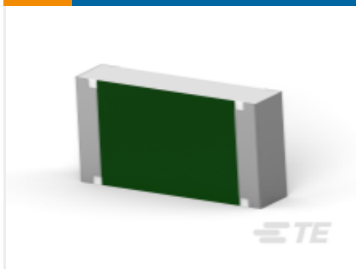
TE 产品编号 9-2176397-8 3502 11K 1%