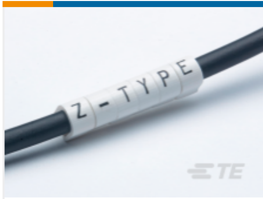
TE 产品编号 EC0437-000 06153411