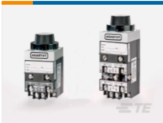
TE 产品编号 7-1472995-0 7012WDS=RLY,STD,ON,2P,96V,50S,S