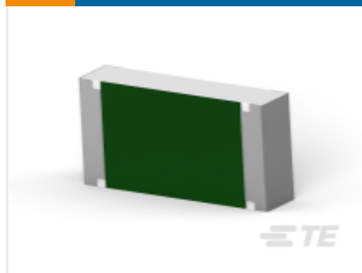
TE 产品编号 2176398-2 3502 15K 1%