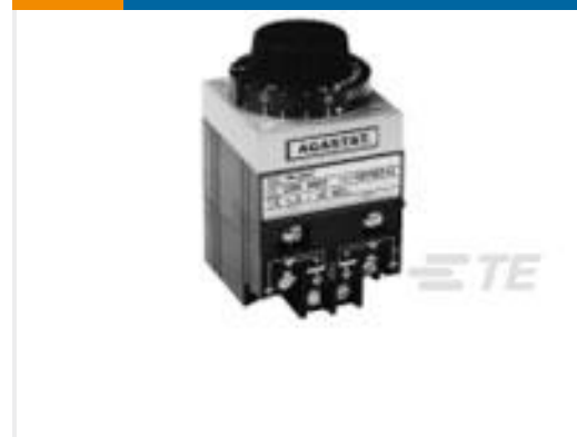
TE 产品编号 6-1755142-4 7022WDIM=RLY,STD,OFF,2P,96V,50S,I, M