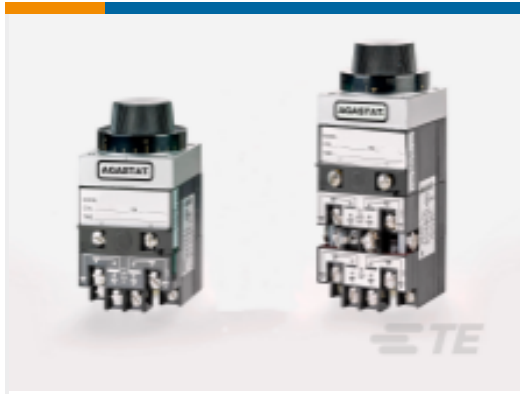
TE 产品编号 1423157-5 7012AC=RLY,STD,ON,2P,120VAC,15