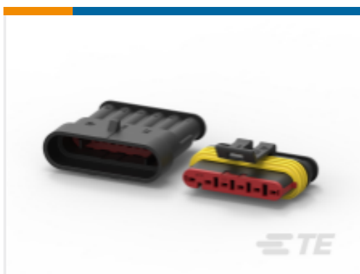
TE 产品编号282104-1 AMP SUPERSEAL 1.5MM, 连接器壳体