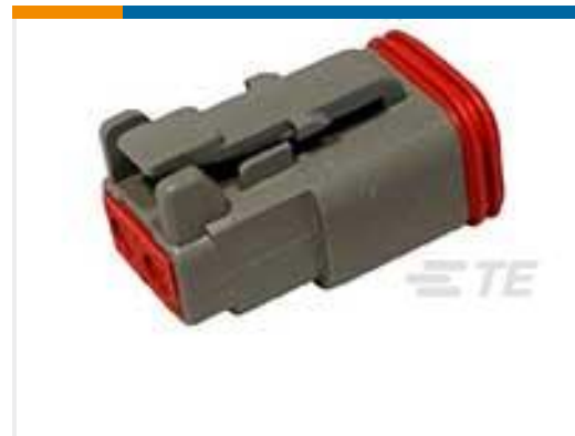
TE 产品编号DT06-2S PLG, 2P, GRY, N