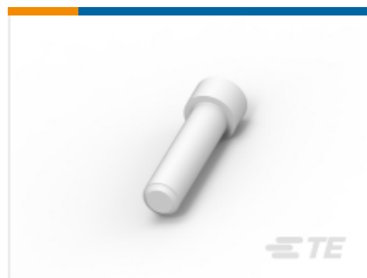
TE 产品编号114017-ZZ SEALING PLUG, SIZE 12/16, WHT