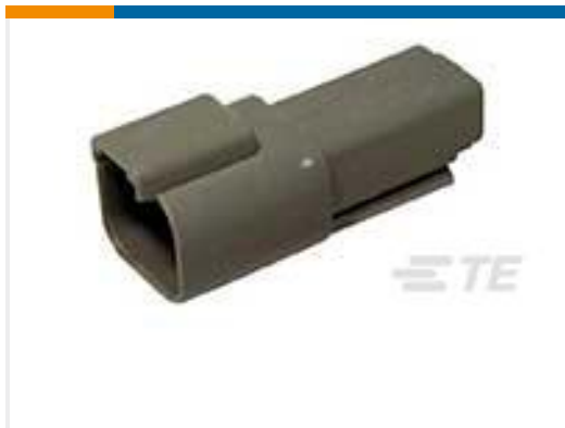
TE 产品编号DT04-2P REC, 2P, GRY, N