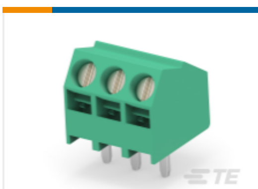
TE 产品编号 1546556-3 3P,STACKABLE,55 DEG,3.5MM