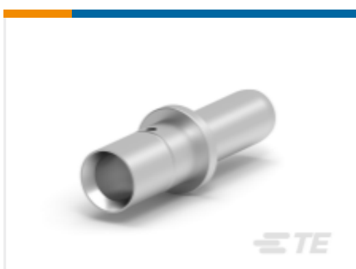
TE 产品编号SRK-PC-080-25-601 PIN, SOLID, SIZE M8, 25mm2, AG