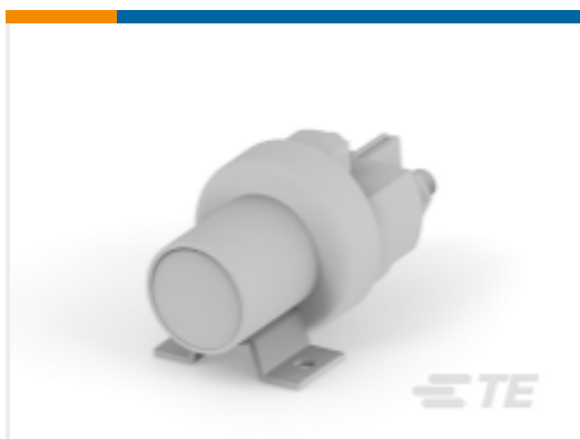
TE 产品编号K1008699 Relay 26-60-05