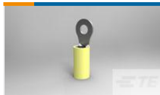
TE 产品编号323916 TERMINAL, PIDG R 26-22 8