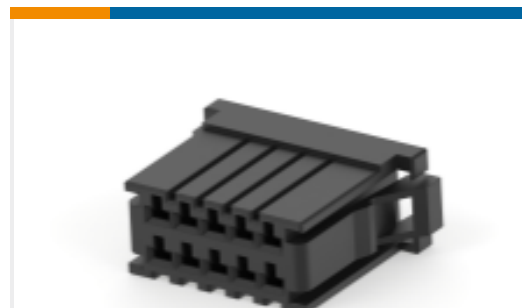
TE 产品编号178803-6 Receptacle and Tab Housing: 3.81 mm pitch, 250V