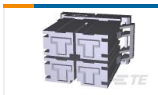
TE 产品编号917807-2 DYNAMIC D-5200 REC HSG ALL-KEY