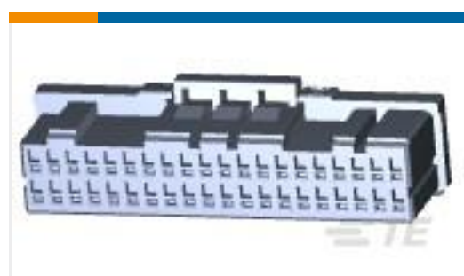
TE 产品编号1-1827863-0 DYNAMIC 1100D REC HSG X 40P BL