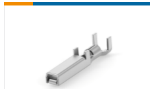
TE 产品编号1-353717-2 Contact: Component To Wire; 15A, 28-14 wire size