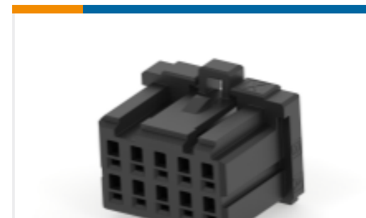
TE 产品编号2-1827864-4 Receptacle and Tab Housing: 2.5 mm Pitch, 250V